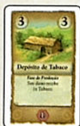
Depósito de Tabaco (8x)