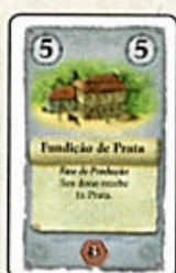
Fundição de Prata (8x)

Um jogador pode ter qualquer quantidade de construções de produção, mesmo repetidas.