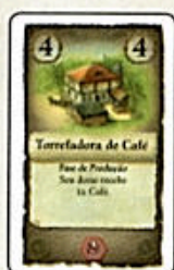
Torrefadora de Café (8x)