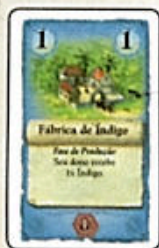
Fábrica de Índigo (10x)

Existem 5 diferentes construções de produção: