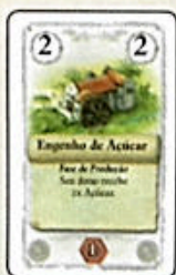
Engenho de Açúcar (8x)